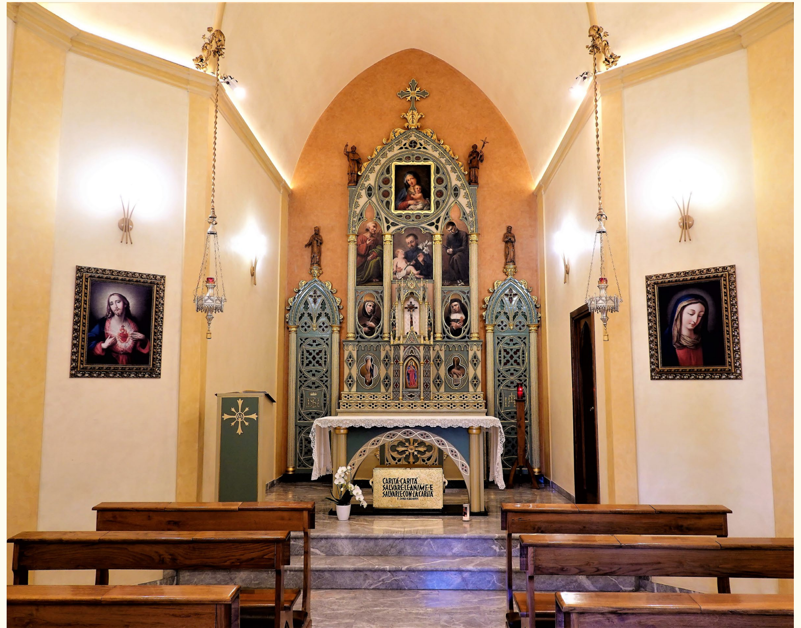
Udine, Chiesetta di San Gaetano – Alle origini della carità